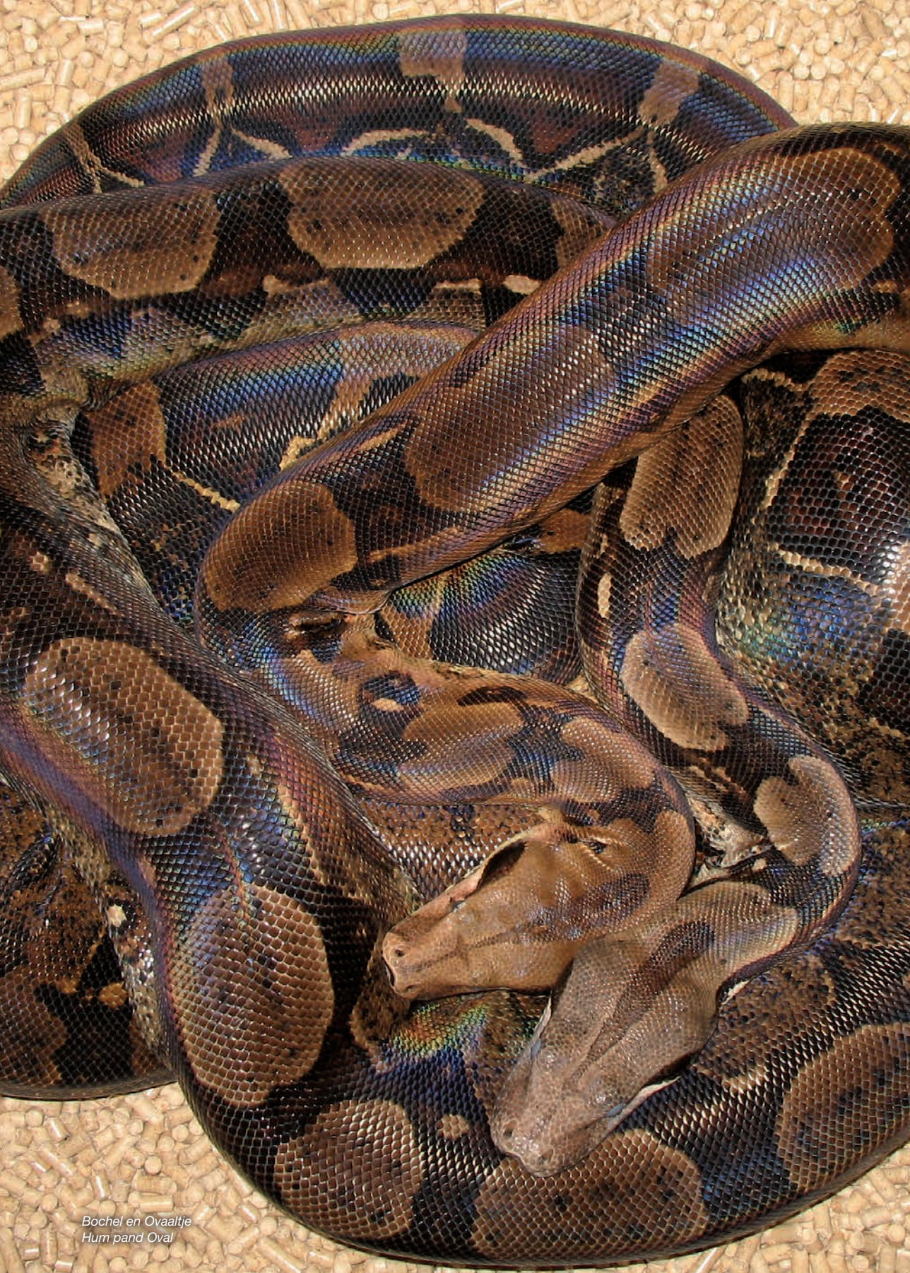
Bochel en Ovaaltje Hum pand Oval