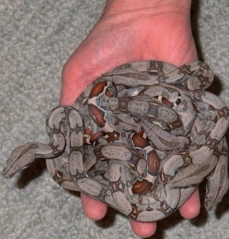
Een handvol 'kerstkindjes'. De jongen die de vervellingen hebben geleverd. A handfull of 'christmas children'. The young who provided the sloughings.